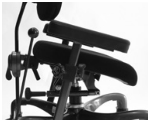
Manuell sittvinkling, standard

Flexbase chassi är standard, vilket gör att stolen alltid står stadigt på ojämna underlag och när man sätter sig och stiger ur stolen. De flexibla inställningarna och det stora tillbehörsprogrammet gör det enklare att skapa en välfungerande arbetsstol efter den enskildes behov. Stolen är modul uppbyggd och kan kombineras i en mängd olika konfigurationer