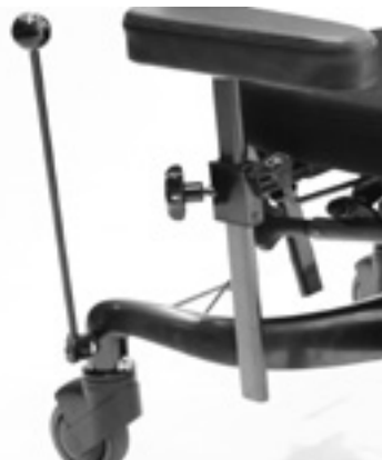
Handbroms, bromsspak standard