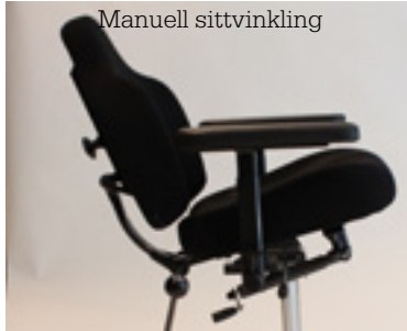
Bålstöd 274001-4500V 7 H